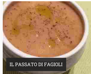
IL PASSATO DI FAGIOLI